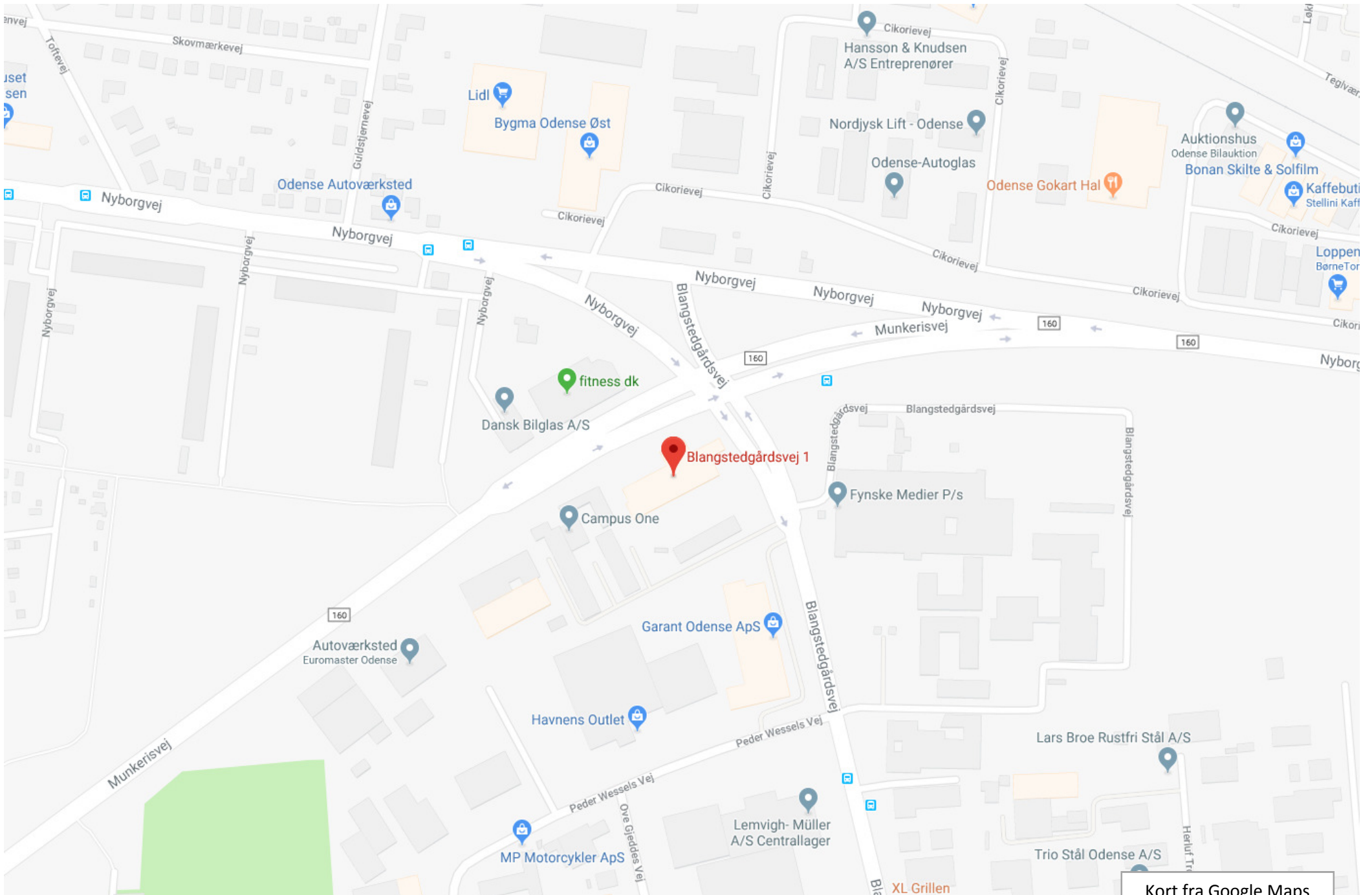
Kort fra Google Maps