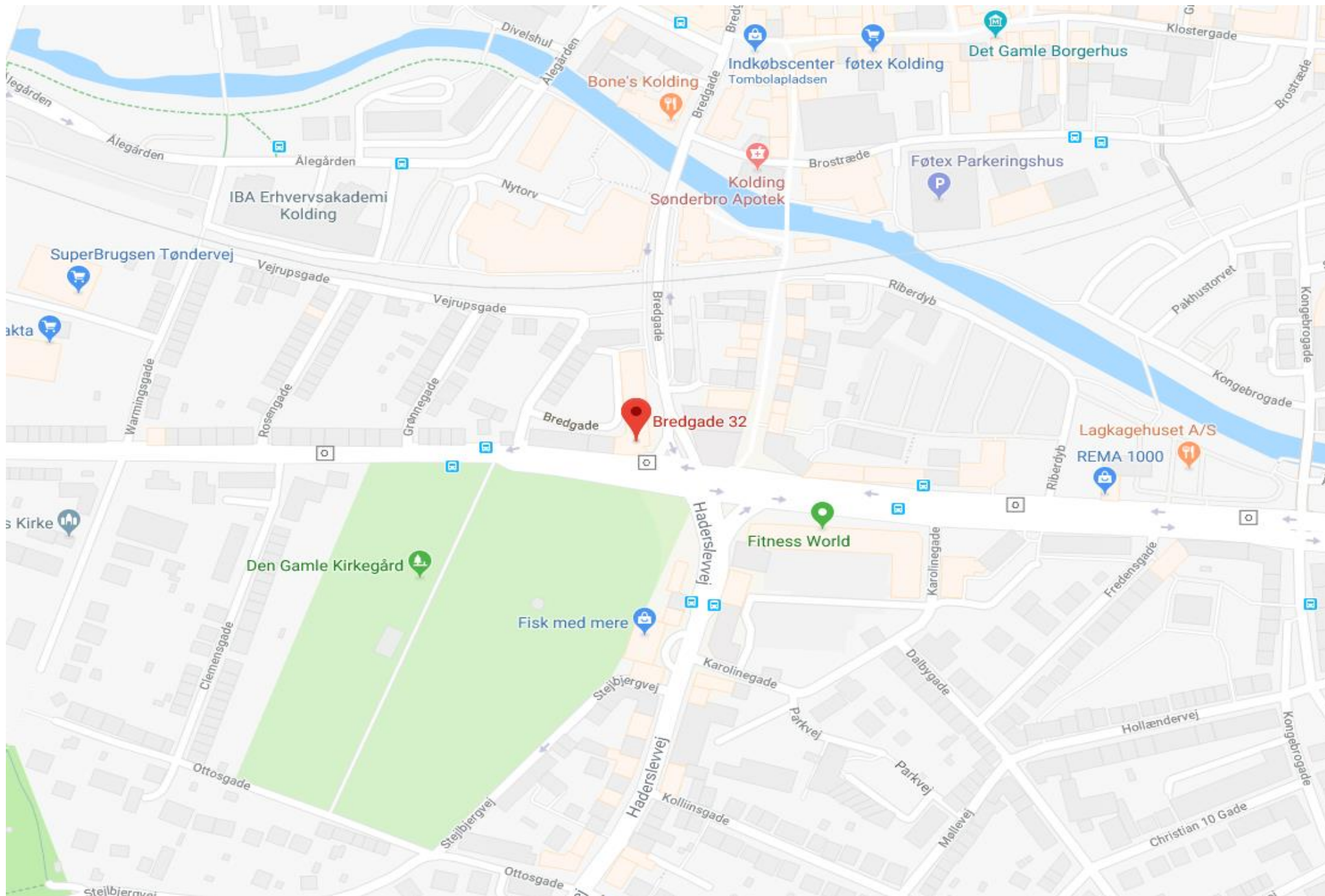
Kort fra Google Maps