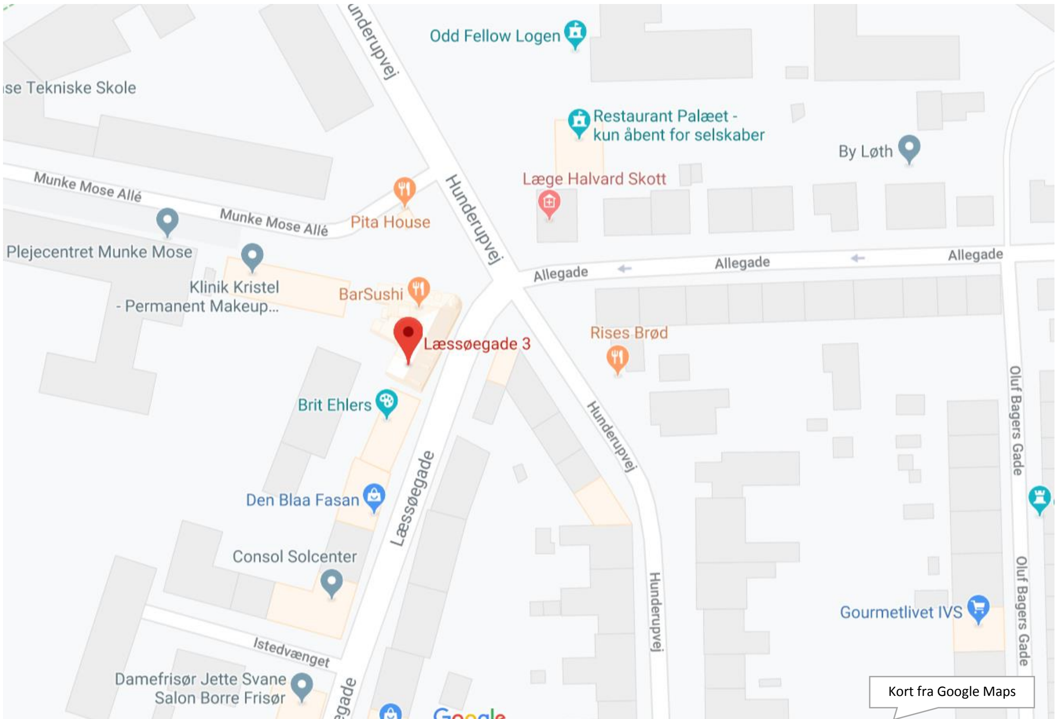
Kort fra Google Maps