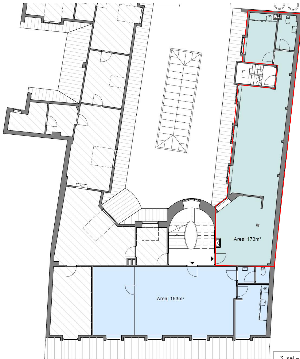
3. sal – Ikke målfast, kun vejledende tegning